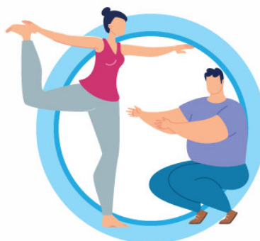
ВЕДИТЕ ЗДОРОВЫЙ ОБРАЗ ЖИЗНИ