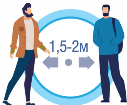
СОБЛЮДАЙТЕ РАССТОЯНИЕ И ЭТИКЕТ