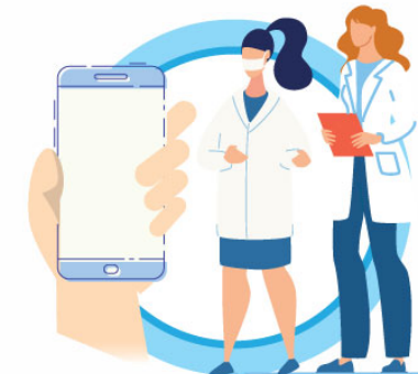
В СЛУЧАЕ ЗАБОЛЕВАНИЯ ОБРАЩАЙТЕСЬ К ВРАЧУ